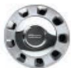
Капацы 14" 0R5