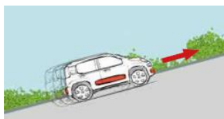
Помош при тргнување